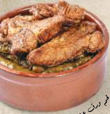
نليه لحم ورق عنب